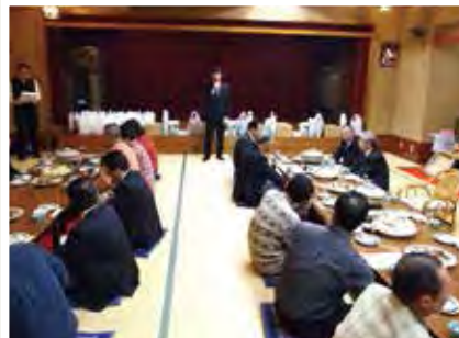
中支部 11月19日(月) 柏屋