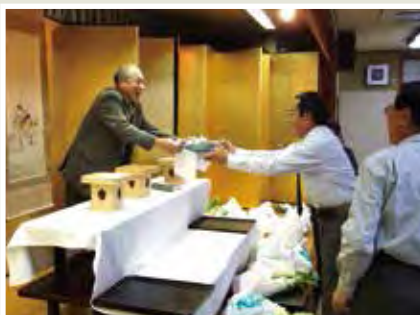
東支部 11月20日(火)めっくんほうす