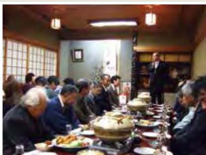
南支部 11月22日(木)かねなか