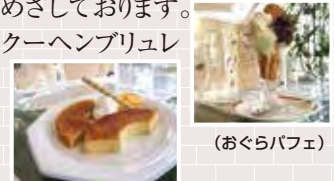
(バームクーヘンブリュレ)

当店のオススメスイーツはバームクーヘンブリュレとおぐらパフェです。バームクーヘンブリュレは仕上げにバームクーヘンをバーナーであぶり、ふわふわなのにサクッとした食感のスイーツです。