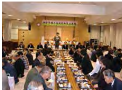
北支部 11月16日(金)浦区ふれあいセンター