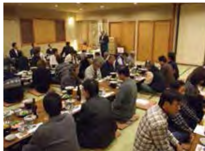
西支部 11月16日(金) 菊屋

各支部で恵比寿講が開催されました。商売の神様とされるえびす様を祀り、商売繁盛とご健勝を祈念しての拝礼。その後懇親会が開催され、よりよい支部活動を目指すため会員同志のコミュニケーションを図り、活発な意見交換が行われました。