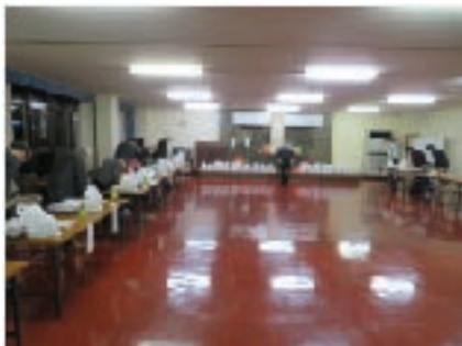
中支部 11月17日（火） 田原市商工会館

令和2年11月に、中支部・北支部・西支部で恵比寿講が開催されました。 商売の神様とされるえびす様を祀り、商売繁盛とご健勝を祈願して拝礼をしました。