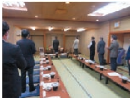
北支部 11月20日（金） 若 草