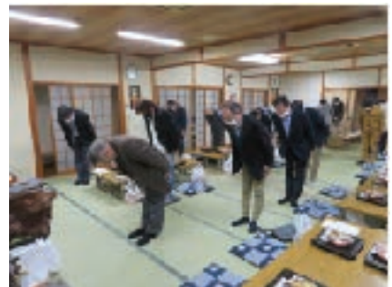
西支部 11月27日（金） マルト清水屋