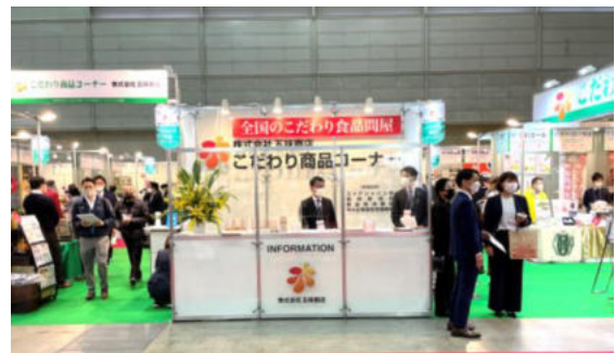
前回のこだわり商品コーナーの様子

こだわり商品コーナーは、上手く活用すれば非常に効果的であることから、前回は 出展案内開始から10分で小間が埋まり、キャンセル待ちが出るほどの人気 を誇る。