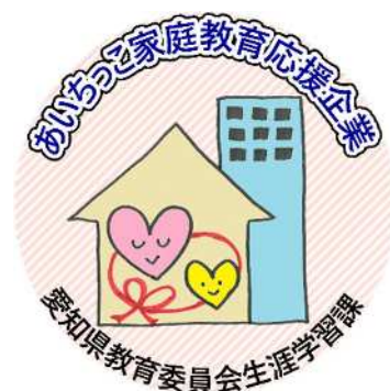
「あいちっこ家庭教育応援企業」 ロゴマーク