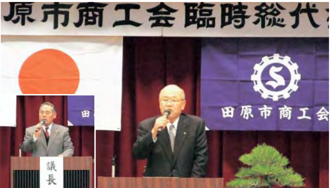
3月11日 田原市商工会臨時総代会