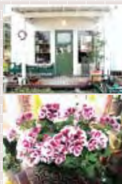
花キュービッド加盟店

今年の母の日は何を贈ろうか?と、お考えの方。今までお花を贈った事のない方。ぜひ一度当店へ来てみてください♪フラワーアレンジ教室もやっていますよ♪